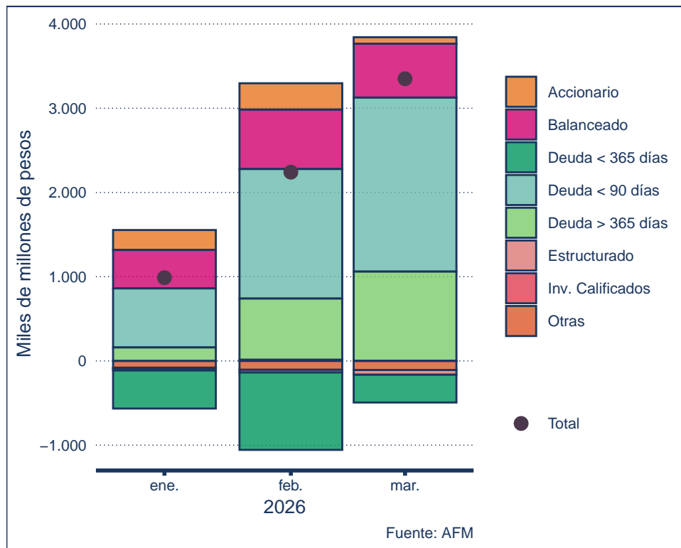
Figura 1: Flujos acumulados en el año por categoría global AFM

Durante marzo de 2026, la industria de fondos mutuos registró 1.108.949 millones de pesos de flujos netos, acumulando 3.349.943 millones en lo que va del año, los que alcanzan un 3,7% del patrimonio efectivo promedio mensual al cierre del año pasado. Para marzo de 2026 el AUM alcanza los 92.826.731 millones de pesos. 2