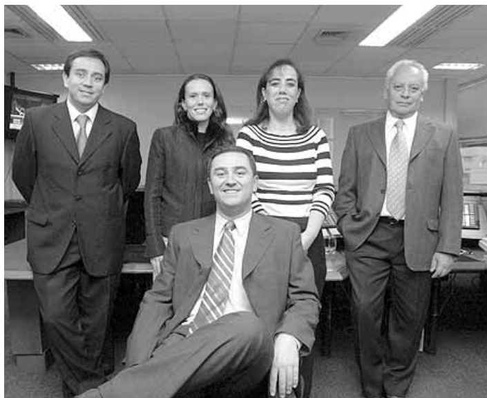
Equipo Citigroup Administradora General de Fondos.