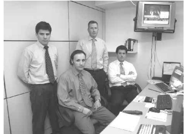
Equipo Cruz del Sur