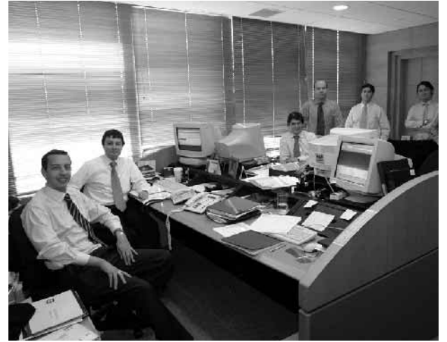
Equipo Celfin Administradora General de Fondos.