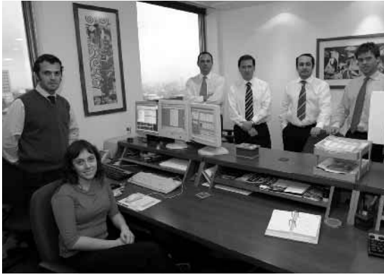
Equipo BICE Administradora General de Fondos.

E l fondo Vanguardia está dirigido a personas o sociedades de inversión de alto patrimonio, interesados en que una fracción de sus altos recursos destinados al ahorro se inviertan en acciones nacionales.