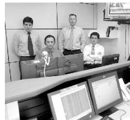
Equipo Cruz del Sur Administradora General de Fondos.