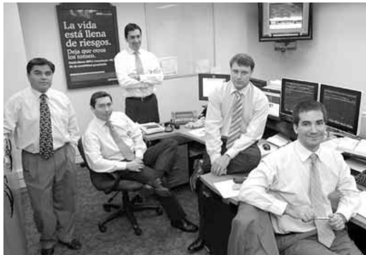
Equipo BBVA Administradora General de Fondos.