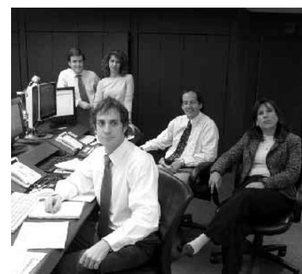
Equipo Consorcio, Administradora General de Fondos.

La porción de acciones de este fondo se utili-