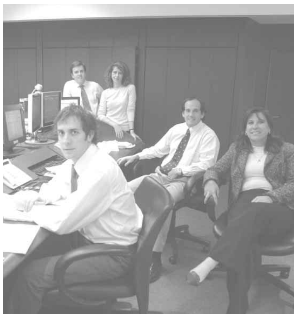
Equipo Consorcio, Administradora General de Fondos.

Es un fondo de corto plazo destinado al manejo de caja de personas y empresas. Gran parte del año pasado, el Banco Central mantuvo la tasa de instancia en su mínimo histórico, reduciendo significativamente la rentabilidad de los depósitos a 30 y 90 días. En este escenario la exitosa estrategia del fondo se centró en una correcta elección de instrumentos que permitió maximizar el riesgo y el retorno de la cartera, lo que se logró mediante la mantención y manejo de una diversificada posición en efectos de comercio y bonos de corto plazo.