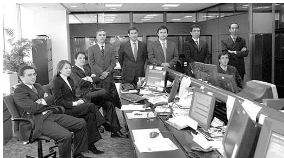
Equipo Santander Santiago, Administradora General de Fondos.